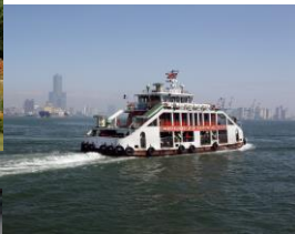
▼ 旗津へ渡るフェリー(※)