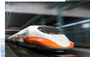
◀ 台湾新幹線(イメージ) ▼ 高雄/蓮池潭の龍虎塔(※)