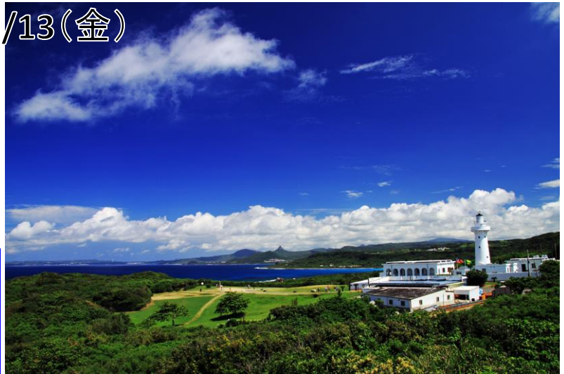
▲ 墾丁/台湾最南端の鵝鑾鼻公園と白亜の灯台(イメージ)※