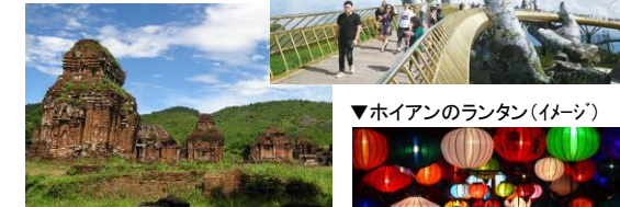
▼ホイアンのランタン(イメージ)