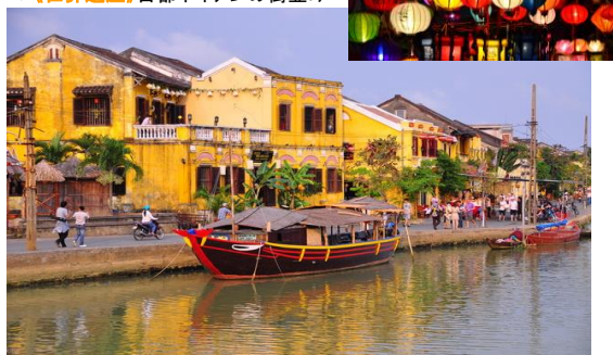
▼《世界遺産》古都ホイアンの街並み