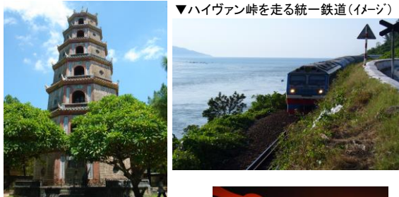
▲《世界遺産》ティエンムー寺/フエ