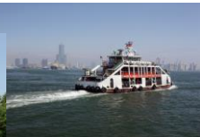
▲旗津へ渡るフェリー(※)