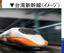
▼台湾新幹線(イメージ)