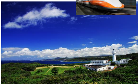
▲墾丁/鵝鑾鼻公園の白亜の灯台(イメージ)(※)